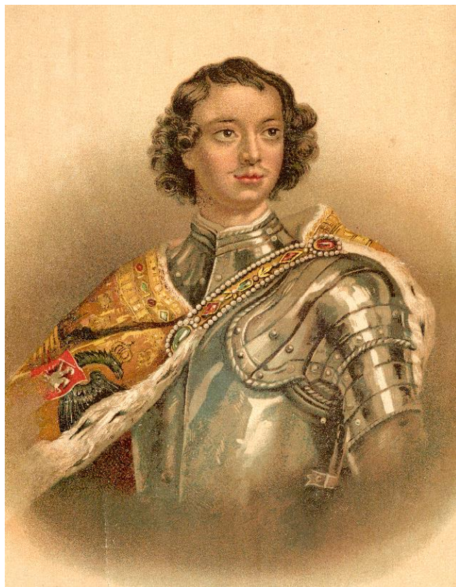
Гунст Петр. Царь Петр Алексеевич Хромолиитография Р.В. Хорна. 1894 г.