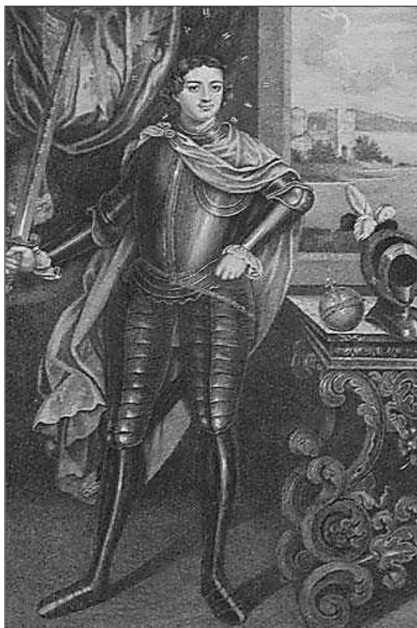
Бобров В. А. Портрет Петра I. XIX в.